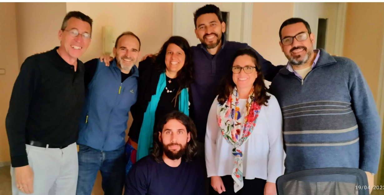
Saint Jacques le Majeur

Nous remercions Caritas pour son accompagnement et son soutien fraternels dans cet important processus de développement institutionnel. Leur visite a été une expérience très enrichissante qui nous aidera à bâtir ensemble de nouveaux chemins de fraternité.