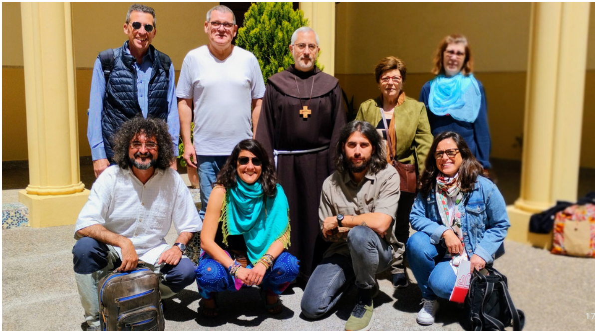
Esprit Saint - Cathédrale