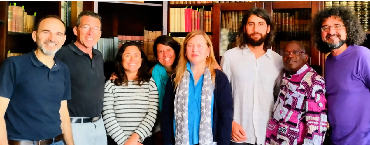
Notre Dame des Victoires