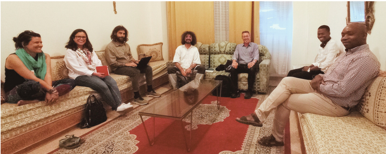
Notre Dame de l'Assomption